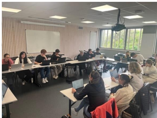
© Tous droits réservés IFSI-IFAS d'Annecy

Renseignements et inscriptions auprès de : Séverine GUILLOT 04 50 63 68 13 ifsi.formation.continue@ch-annecygenevois.fr